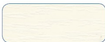
P51ac - Bianco wood